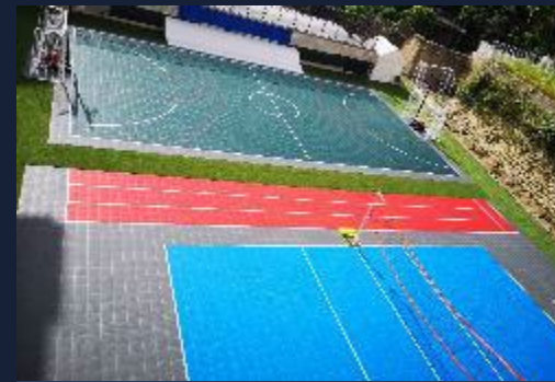
Intervento outdoor grandi dimensioni