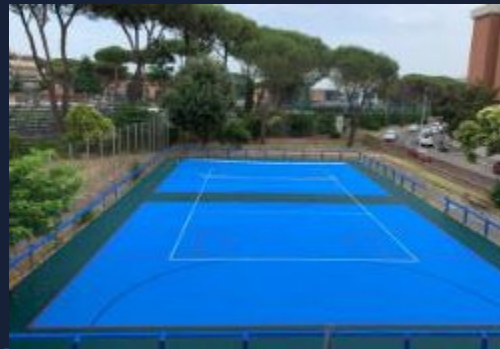
Intervento outdoor medie dimensioni