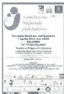
locandina giornata mondiale dell'autismo.jpeg 424K

Segreteria Assessore alle Attività Sociali e Socio-Sanitarie Palazzo Natale di Monterosato Via Garibaldi, 26 - Palermo Tel. 0917404266