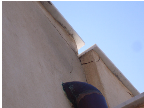
Fig. 8 Distacco di intonaci e malta sottostante Pluviali non funzionanti