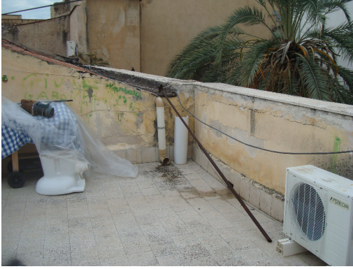
Fig. 11 Sostituzione pluviali zoccoletto Pavimentazione e impermeabilizzazione