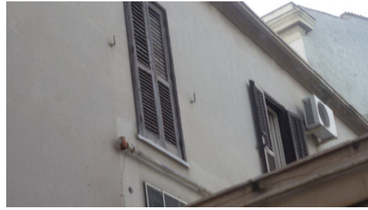
Fig. 12 Cornicione da risanare ed infissi da revisionare e tinteggiare