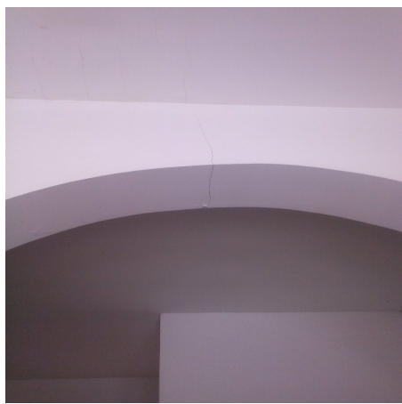
Fig. 1 Lesione nell'intonaco della chiave di volta dell'arco