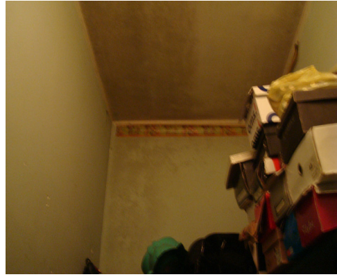
Fig. 6 Muffa sulle pareti microlesioni sugli intonaci