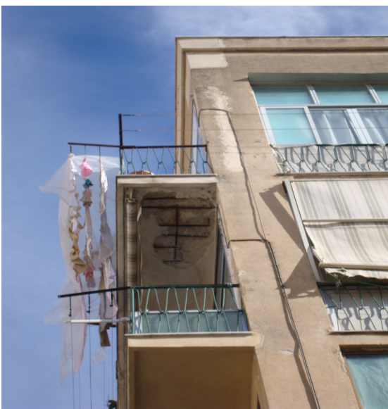
Fig. 9 Intradosso dei balconi da risanare