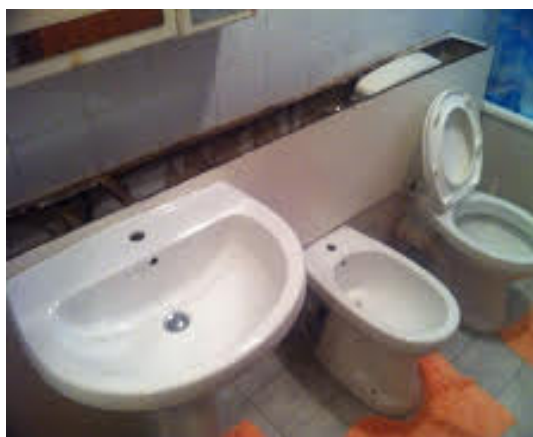
Fig. 3 Impianti idrico-sanitari non funzionanti Pezzi sanitari e rivestimenti da sostituire