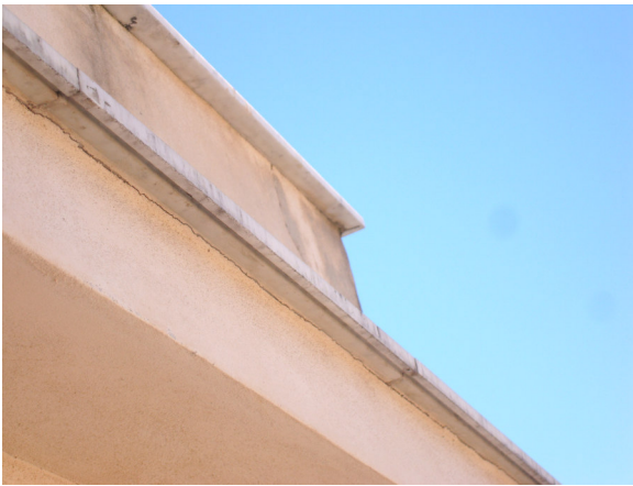
Fig. 7 Prospetto con intonaci lesionati, sporchi e pieni di muffa e microorganismi. e copertina in marmo da sostituire