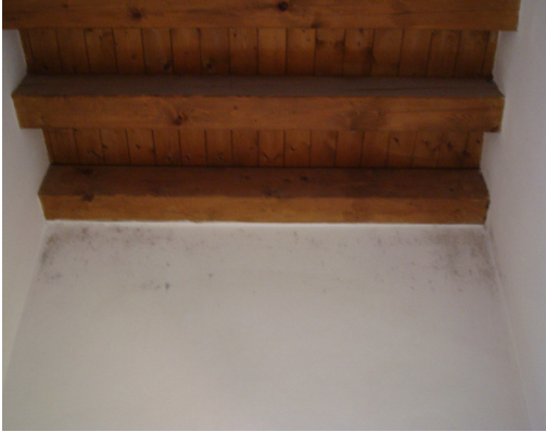
Fig. 5 Presenza di muffa sulle pareti