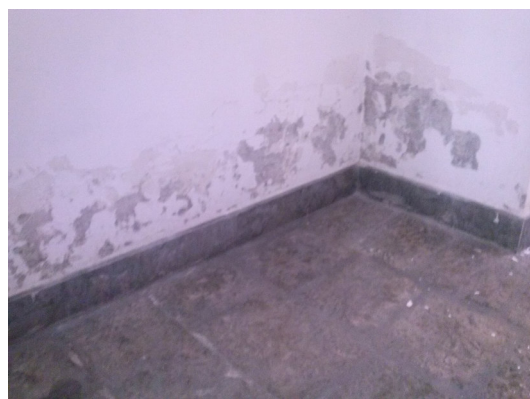
Fig. 2 Umidità di Risalita capillare intonaci ammalorati e zocchetto da sostituire