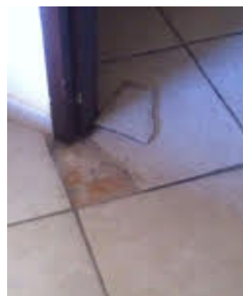
Fig. 4 Pavimentazione servizi e locali lesionata o mancante