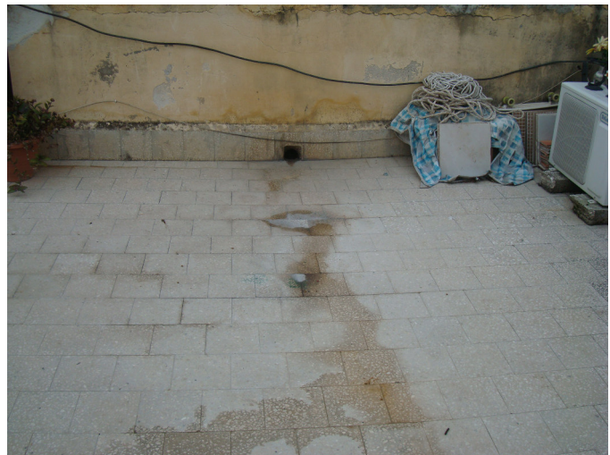
Fig. 10 Terrazza con problemi d'infiltrazione d'acqua muretti d'attico da risanare.