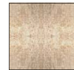
Rivestimento in mosaico