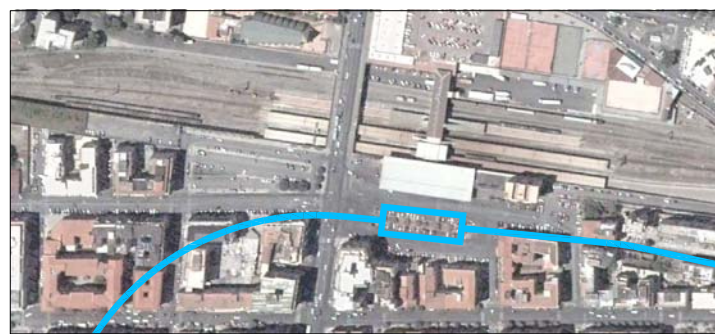
scala 1: 2000