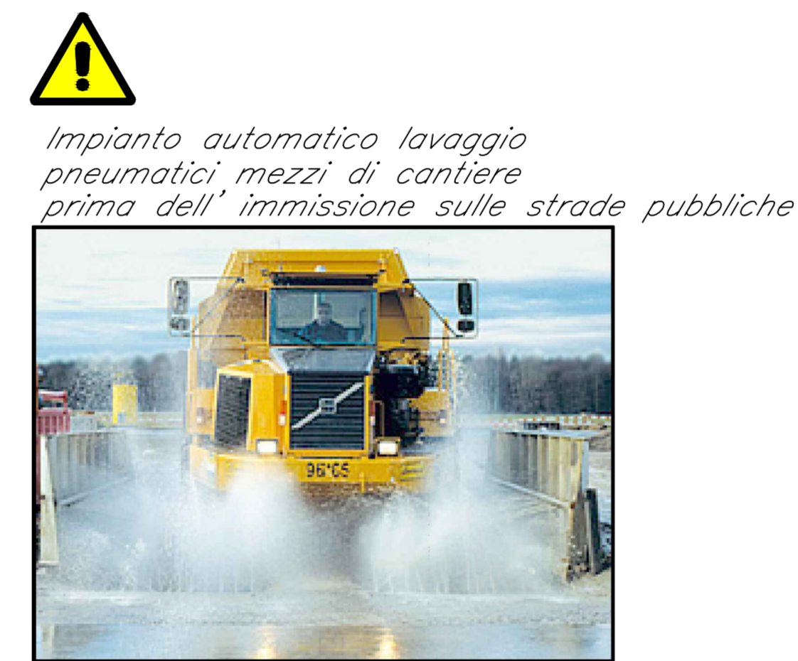
Impianto automatico lavaggio pneumatici mezzi di cantiere prima dell'immissione sulle strade pubbliche