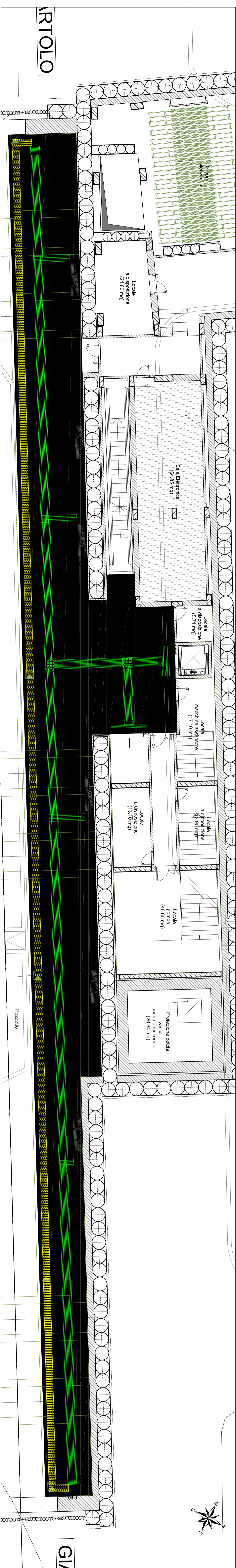
PIANTA LIVELLO MEZZANINO CON PAVIMENTAZIONE SISTEMA LOGES