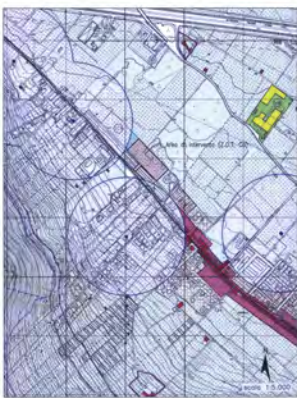
STRALCIO DELLA VARIANTE GENERALE AL P.R.G. DI PALERMO