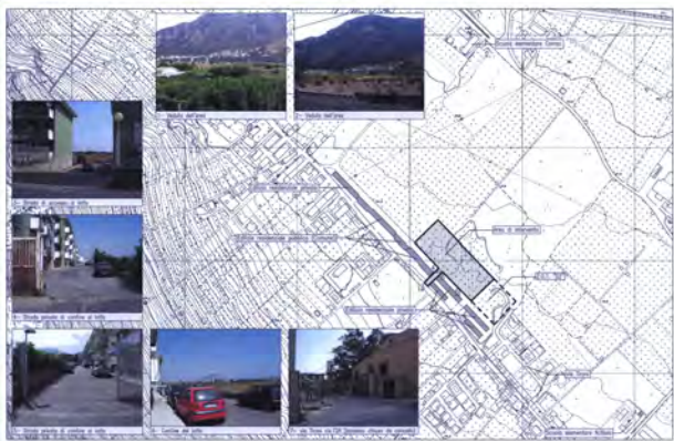
DOCUMENTAZIONE FOTOGRAFICA DEGLI STATI DEI LUOGHI