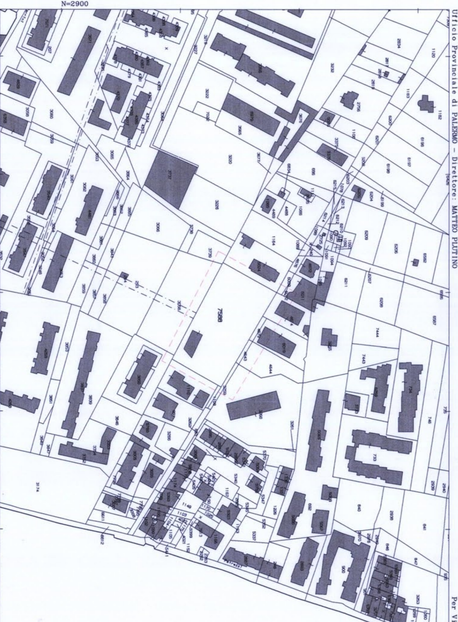
STRALCIO PLANIMETRICO CTR SCALA 1:2000

Comune: PALERMO Foglio: 38 All. B Scala originale: 1:2000 Dimensione cornice: 534.000 x 378.000 metri 28-Mar-2011 12:31 Prot. n. T224586/2011