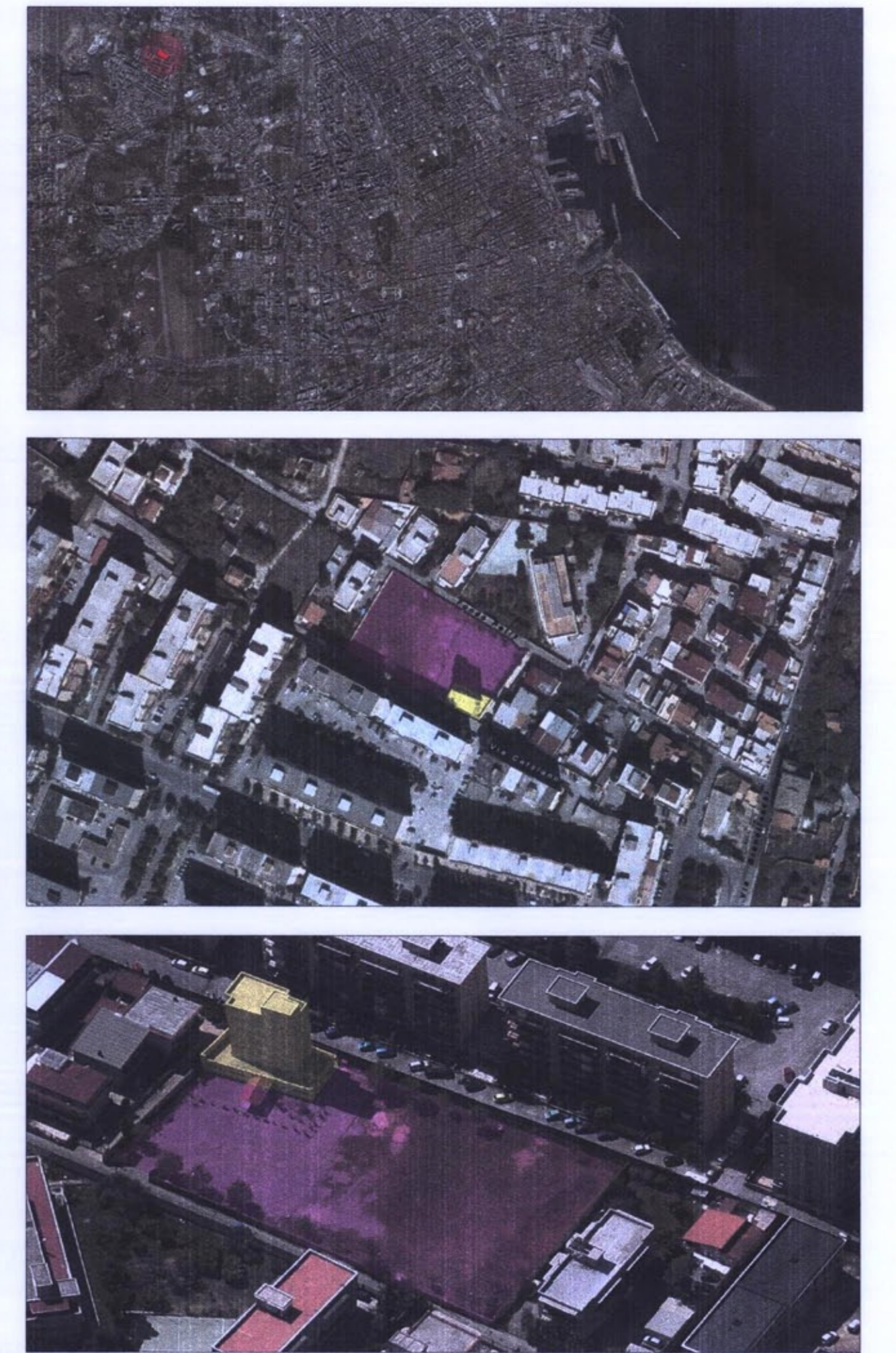
VISTE SATELLITARI ED AEREE DELL'AREA DI INTERVENTO