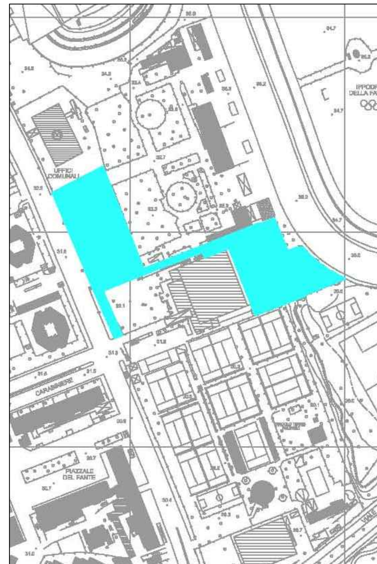
AREA D'INTERVENTO CON PLANIMETRIA DI PROGETTO SCALA 1:2000