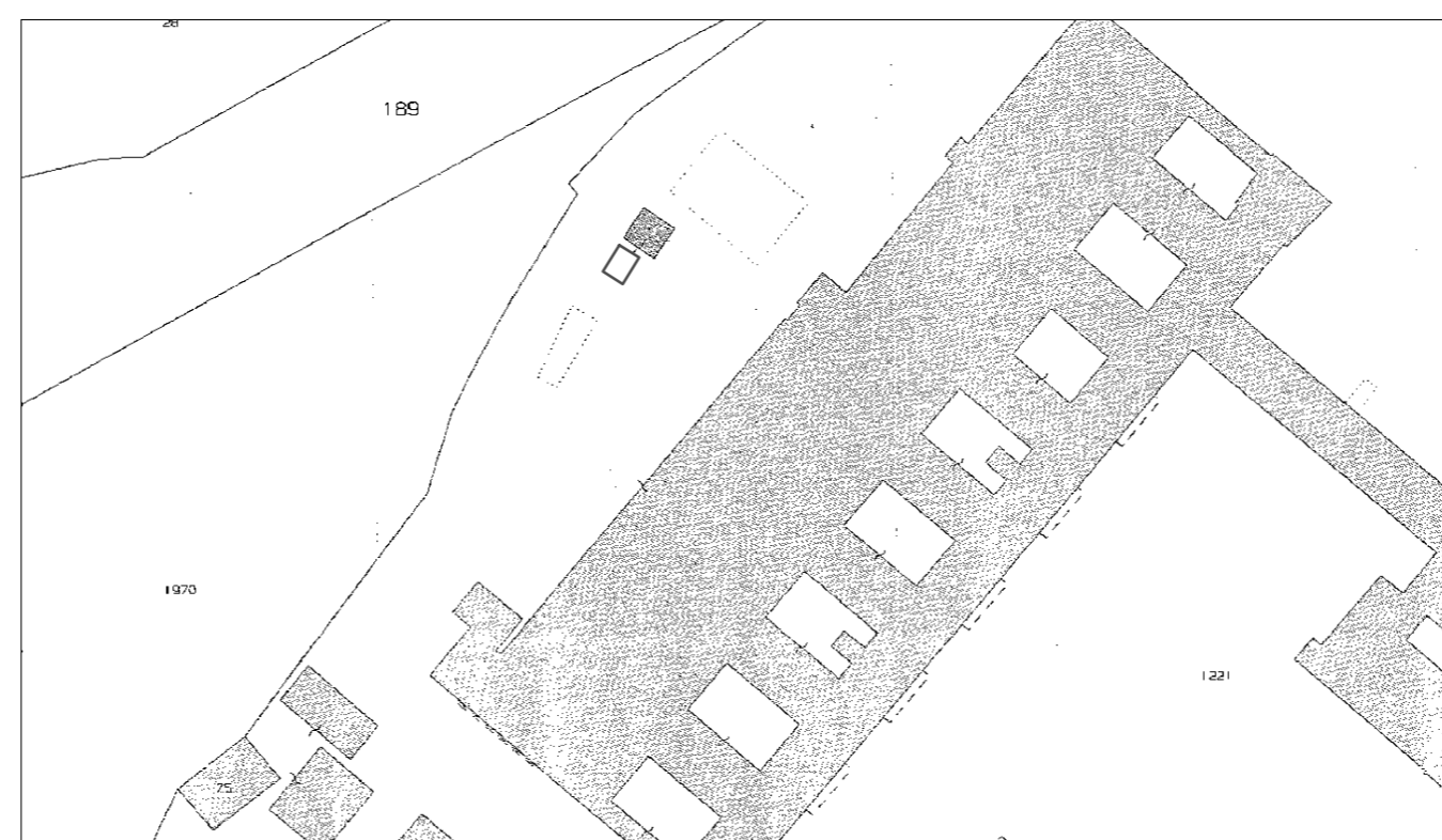
STRALCIO PLANIMETRIA CATASTALE 1:2000 FOGGIO 60 - P.LLA 1221