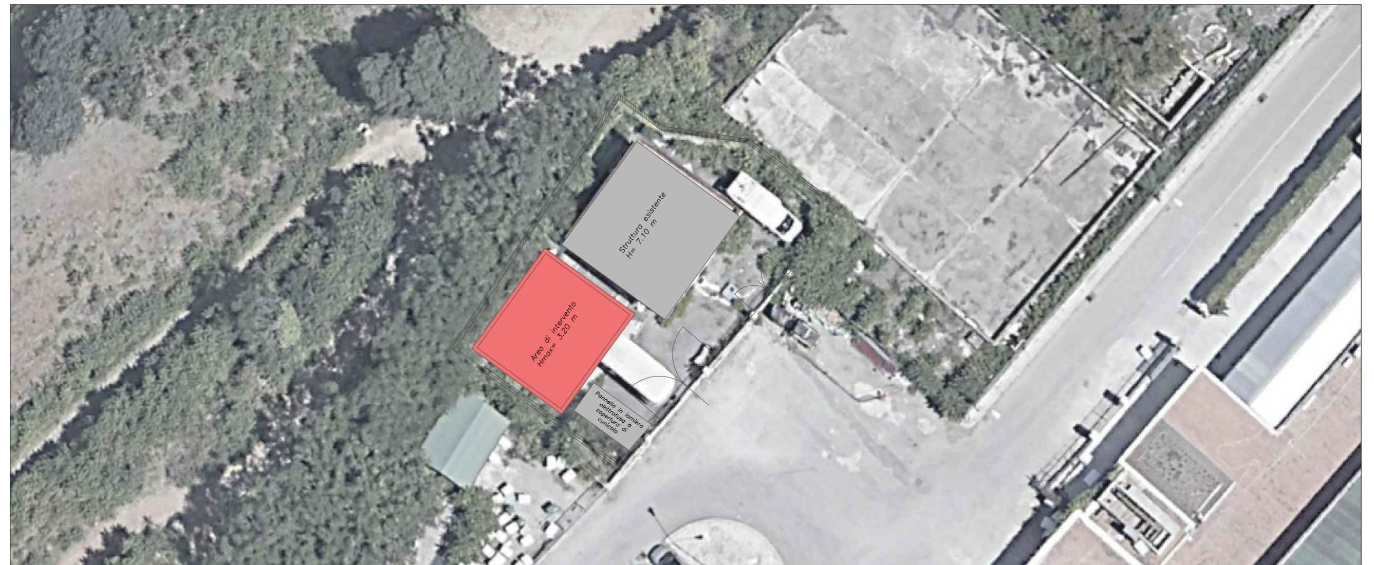
INQUADRAMENTO DI MASSIMA STRUTTURA 1:300