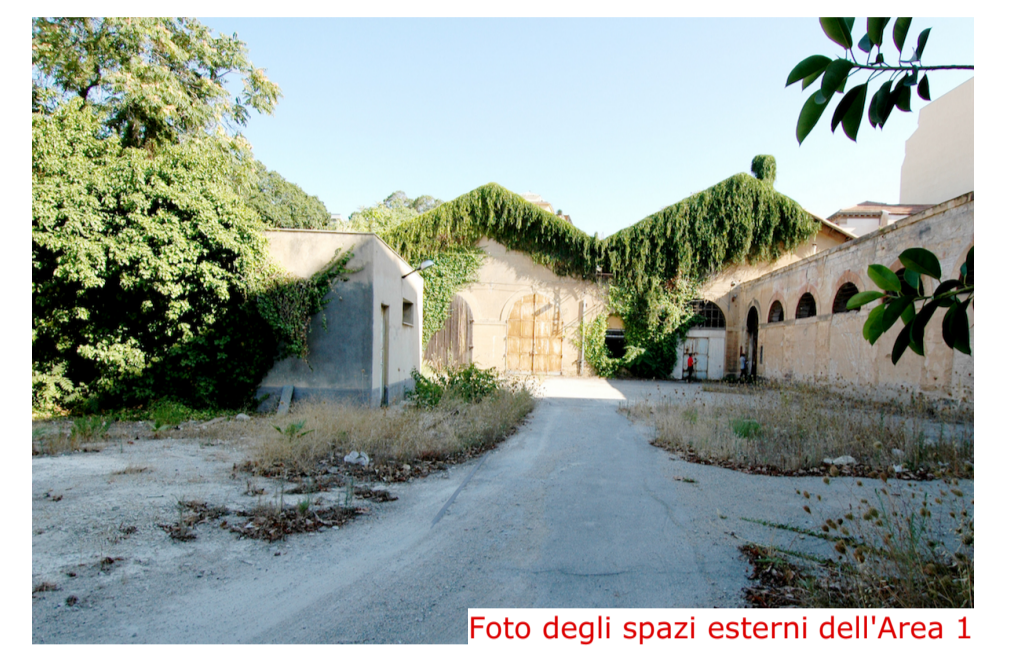
Foto degli spazi esterni dell'Area 1