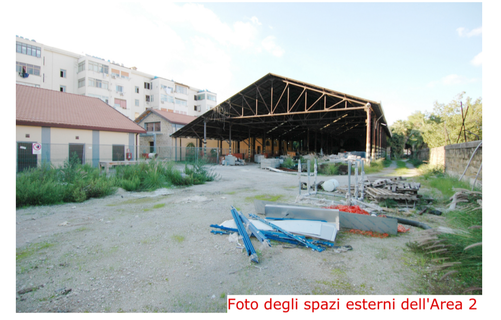
Foto degli spazi esterni dell'Area 2