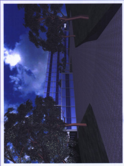
2 - Ingresso Carrabile lato Ovest