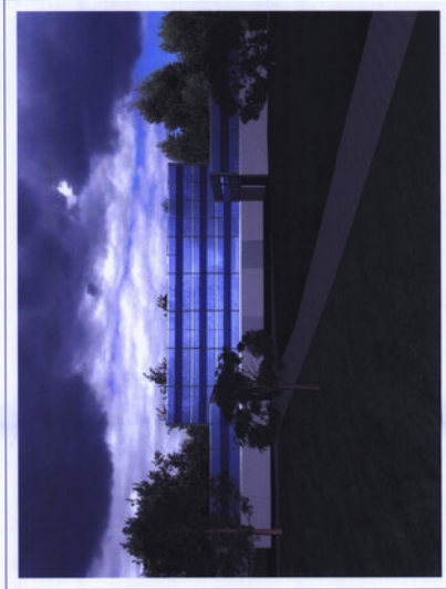
4 - Lato valle con ingresso cantinato