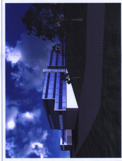
3 - Veduta lato valle