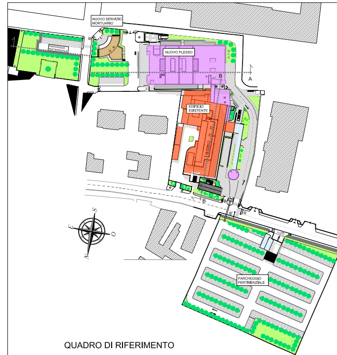
QUADRO DI RIFERIMENTO