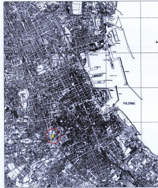
RILIEVO AEROFOTOGRAFOMETRICO - SCALA 1:25.000