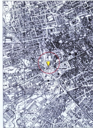
C.T.R. - SCALA 1:10.000