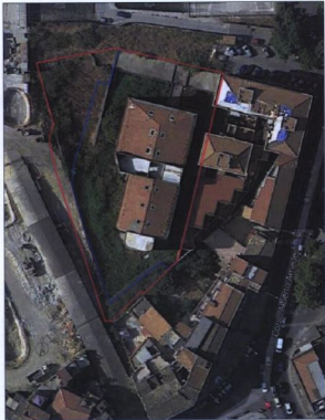
STRALCIO DI ORTOFOTO CON SOVRAPPOSIZIONE DELL'AREA

Perimetro collatale area d'intervento programma costruttivo Perimetro area d'intervento programma edilizio