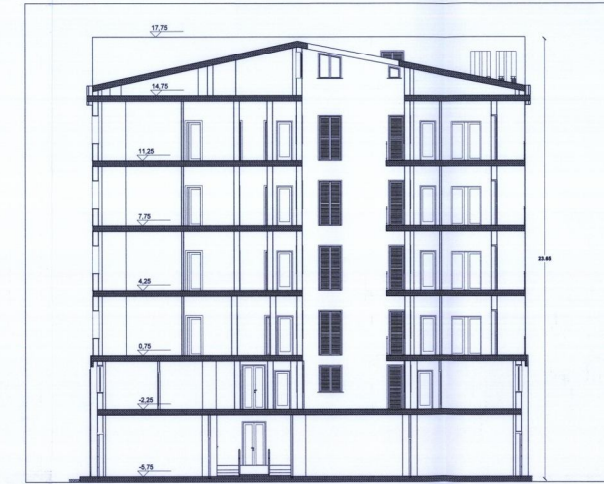
Sezione 2-2 1:100