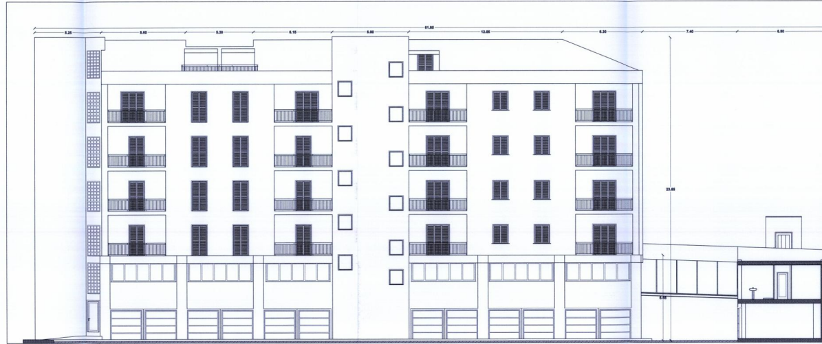
Prospetto est 1:100