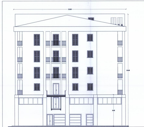
Prospetto principale su via levicola 1:100