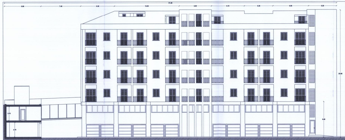
Prospetto ovest 1:100