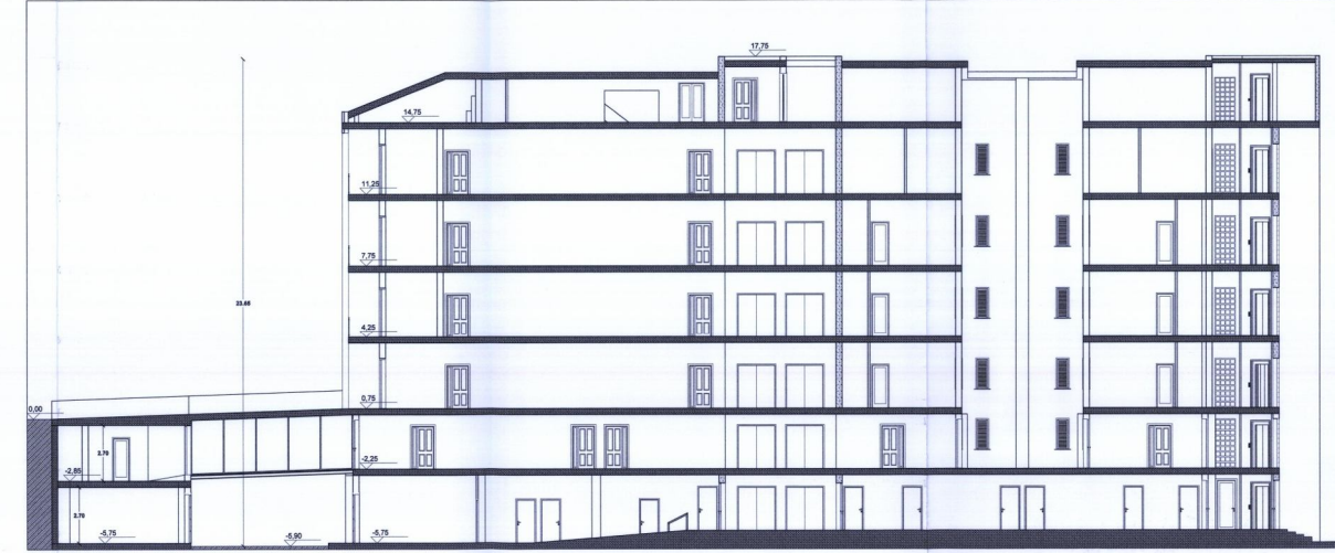
Sezione 1-1 1:100