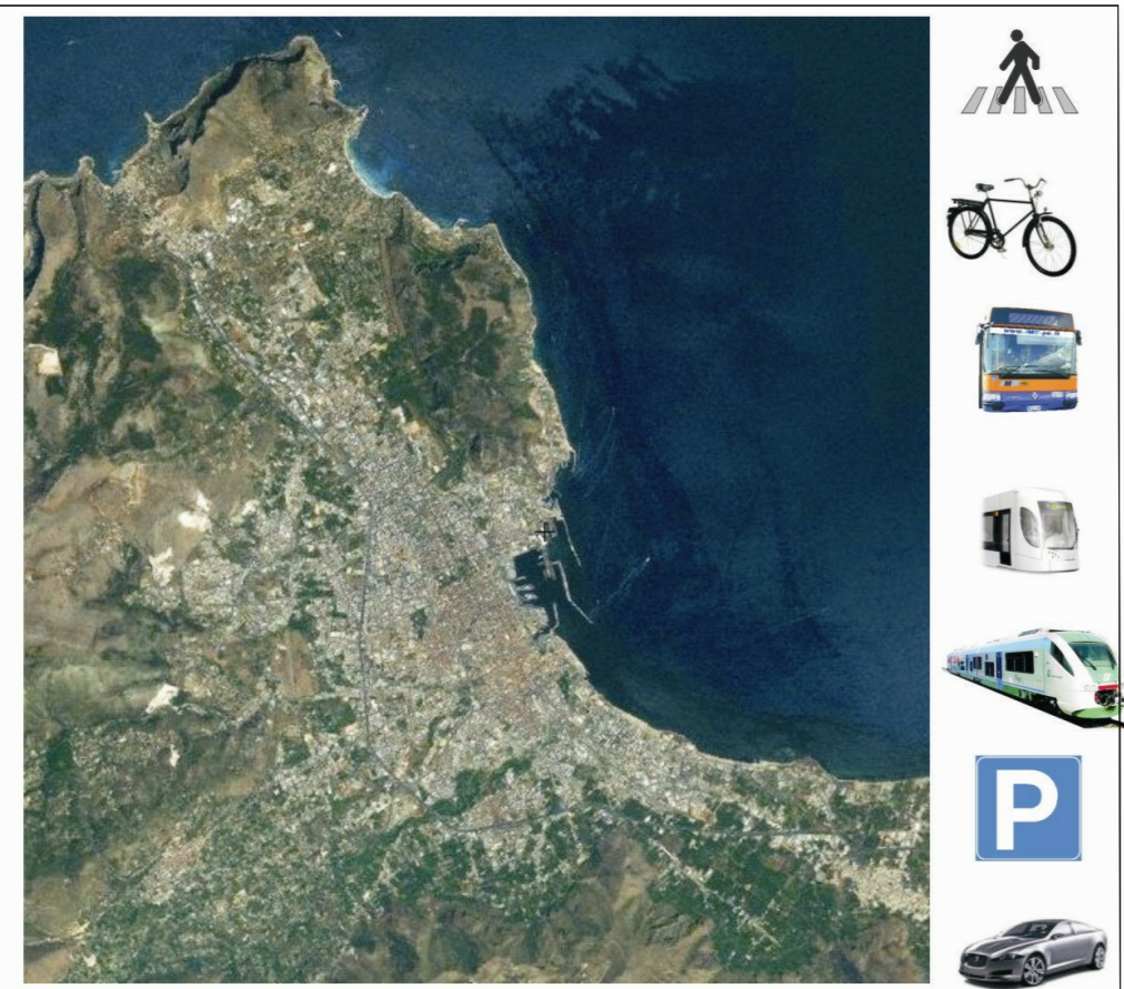
tavola: A1 oggetto: Delimitazione dei centri abitati e zonizzazione scala: 1:25.000