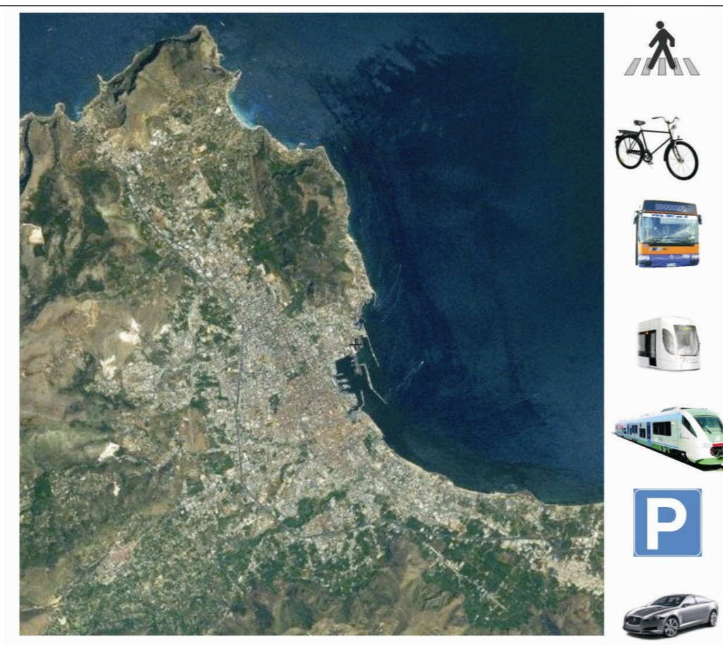
tavola: A5 a oggetto: Schemi di circolazione - stato di fatto scala: 1:10.000