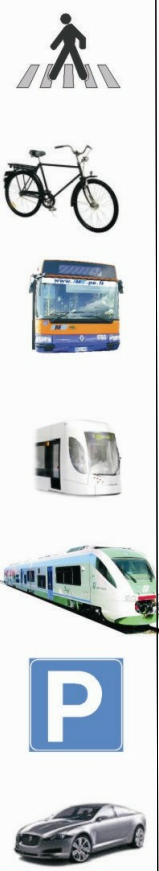
tavola: A11 c oggetto: Classifica funzionale delle strade (vigente) scala: 1:10.000