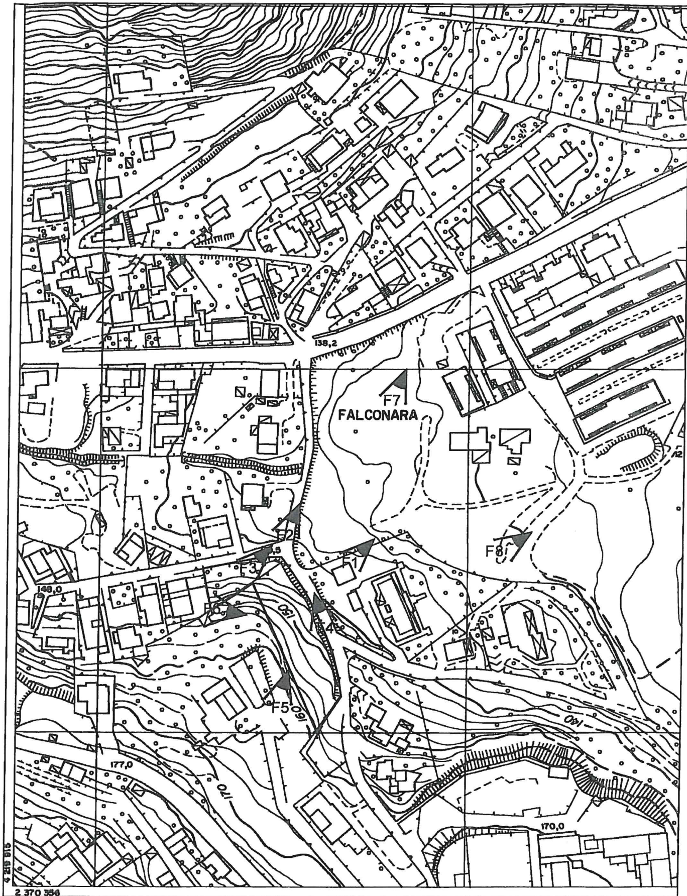
PLANIMETRIA CON INDICAZIONE DEI PUNTI FOTOGRAFICI