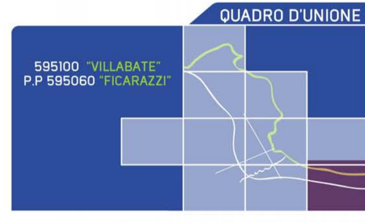
TAVOLA A1d CARTA DELLA SUSCETTIVITA' ALL'EDIFICAZIONE 1:10.000

PRG2.0 PIANO REGOLATORE GENERALE PALERMO 2025