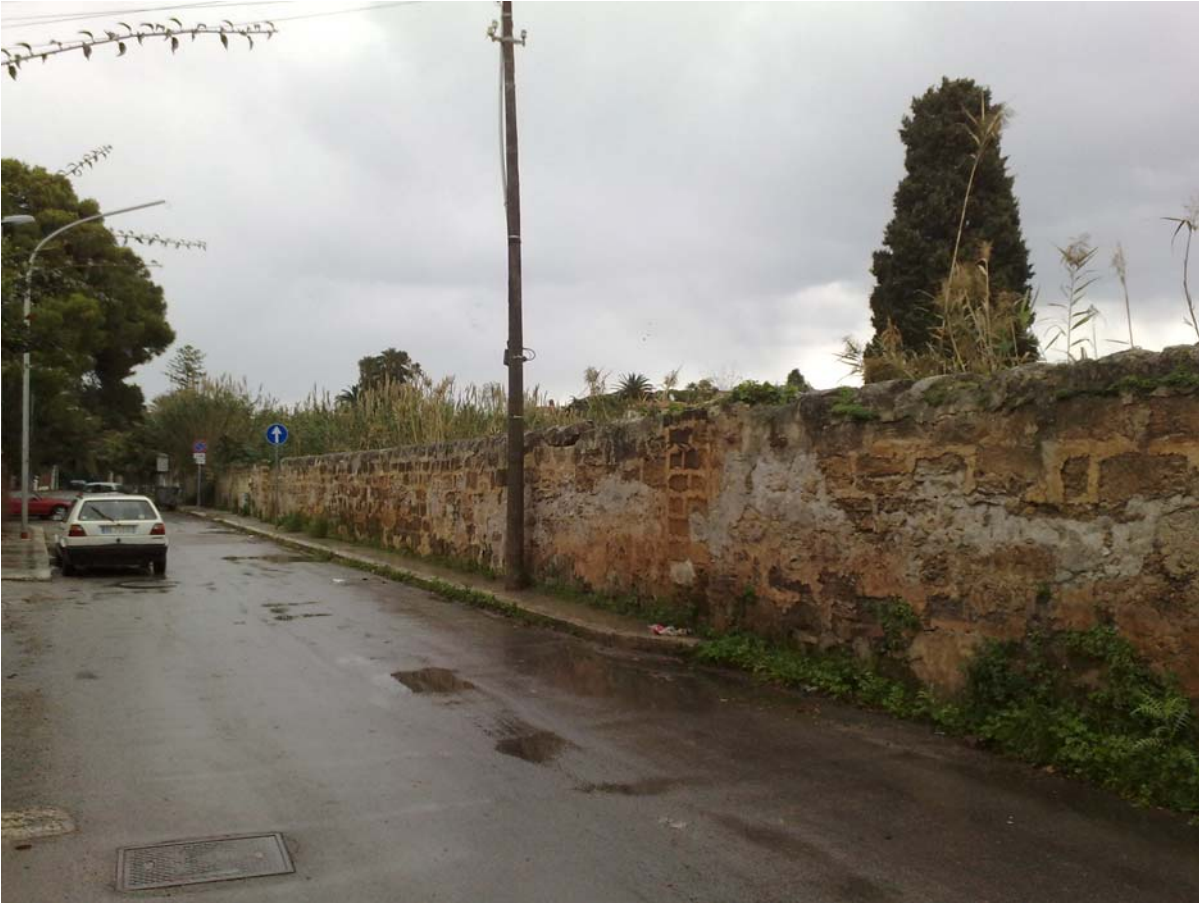
Foto15: Via Mondello