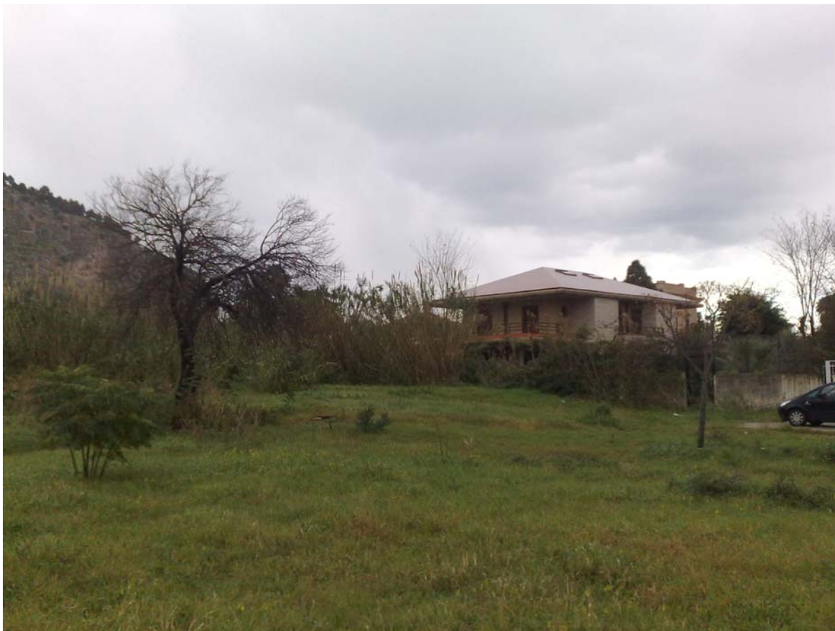
Foto07: Via Palinuro