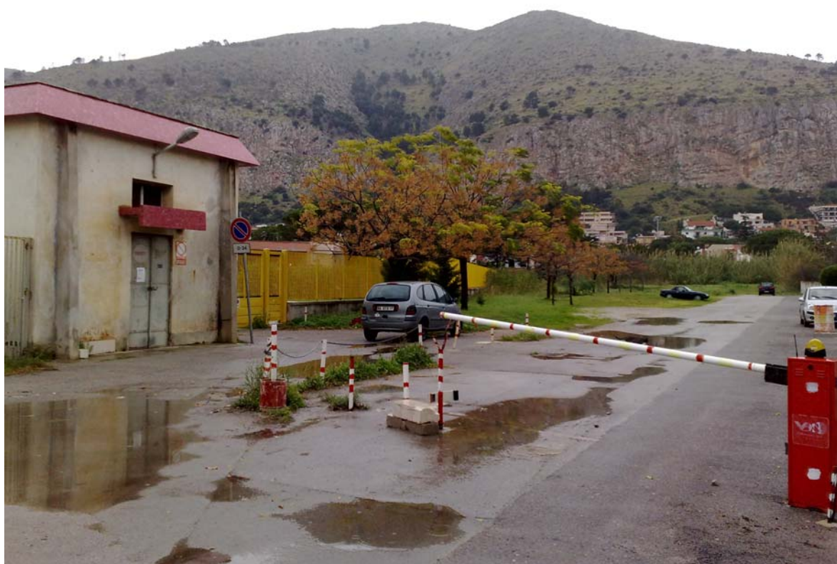
Foto02: Via Palinuro