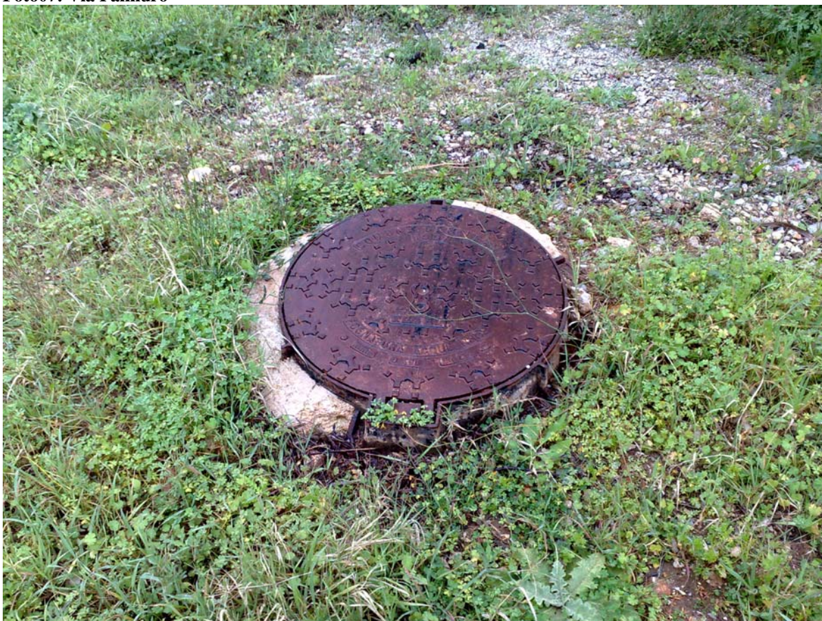
Foto08: Via Palinuro