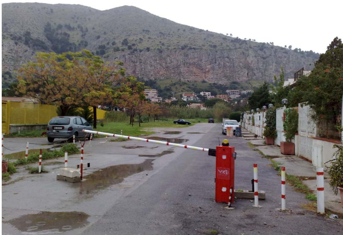
Foto03: Via Palinuro