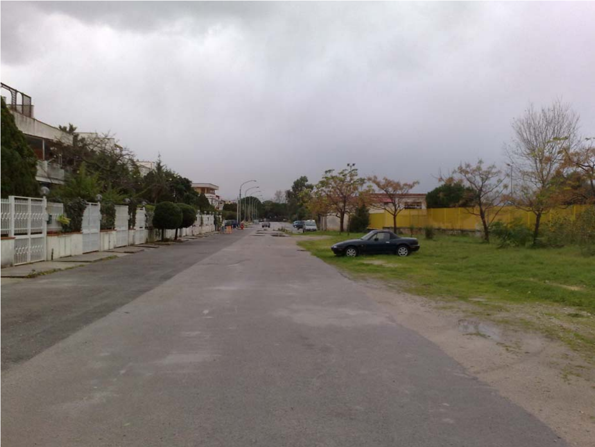
Foto13: Via Palinuro