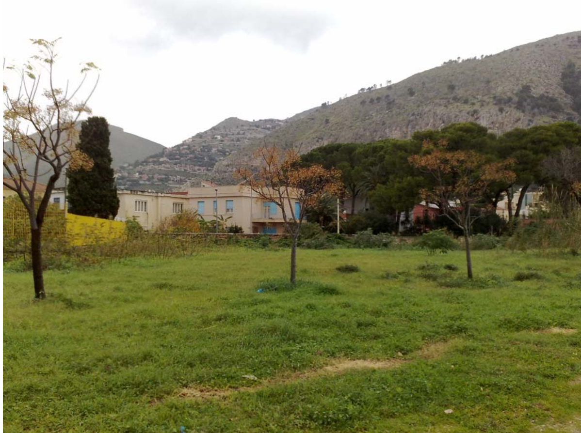
Foto06: Via Palinuro