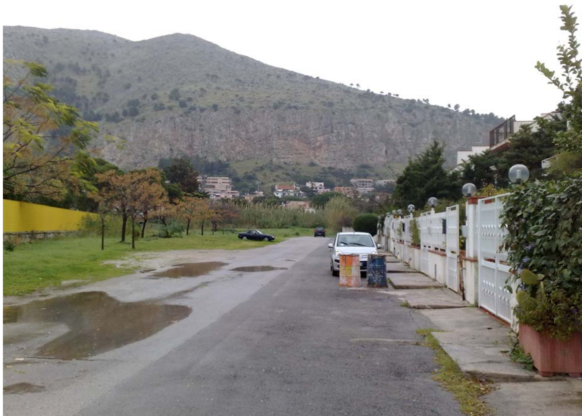
Foto05: Via Palinuro