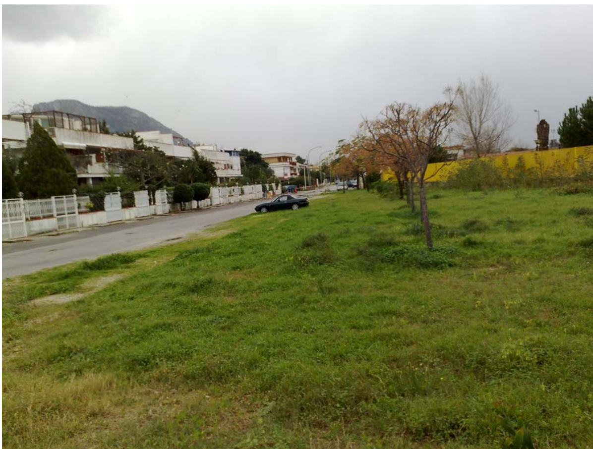
Foto10: Via Palinuro