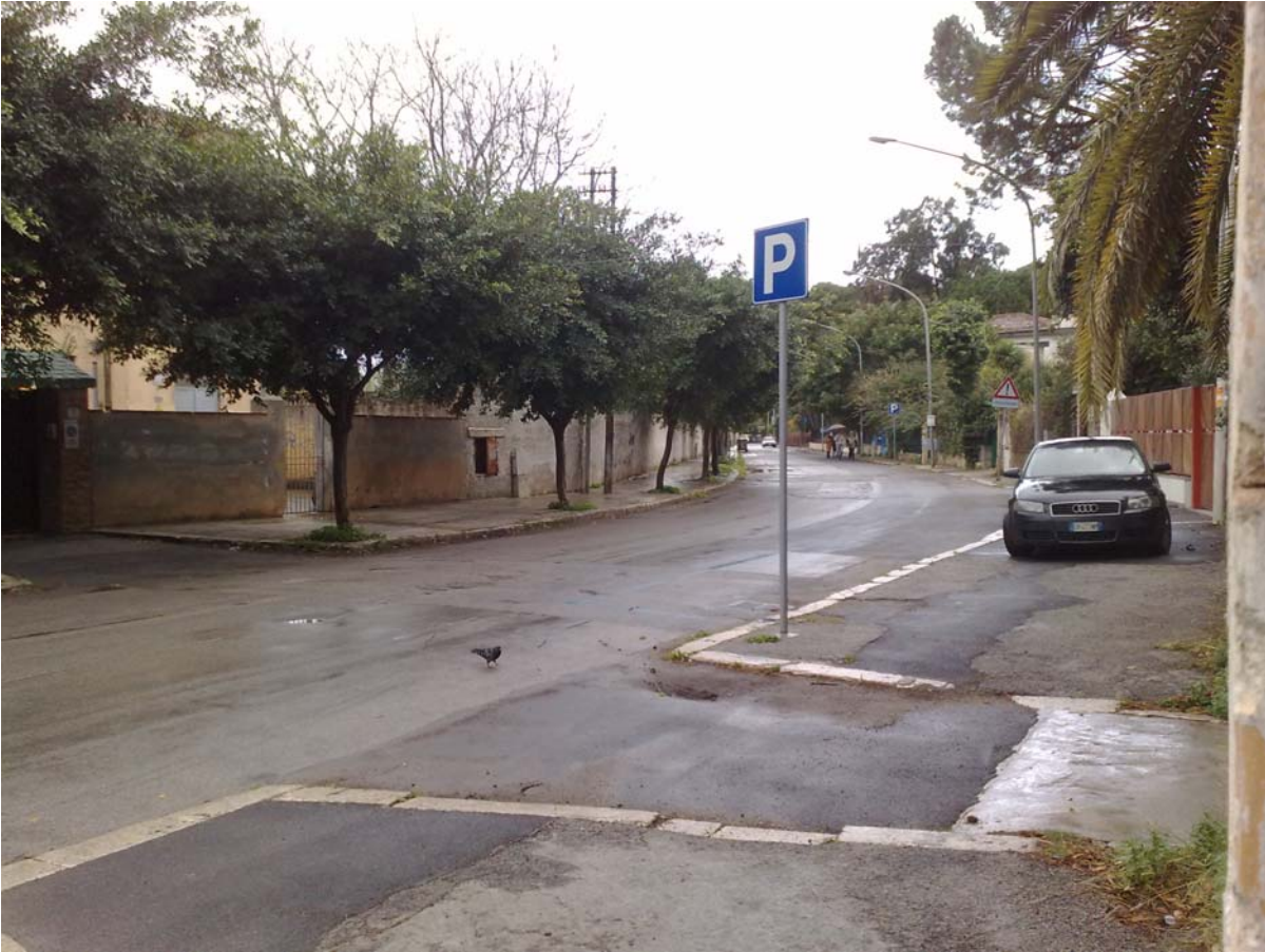
Foto17: Via Mondello