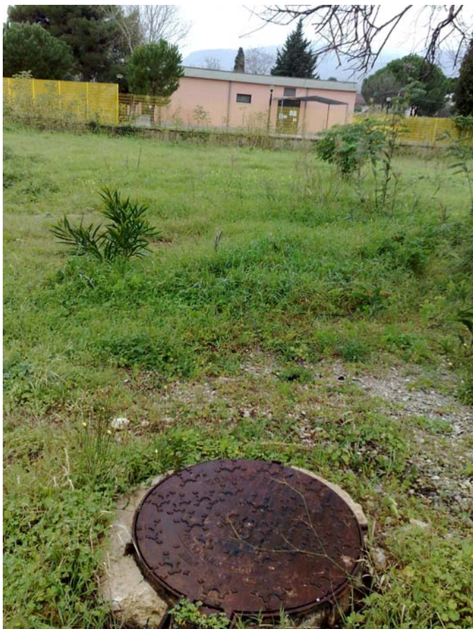
Foto09: Via Palinuro