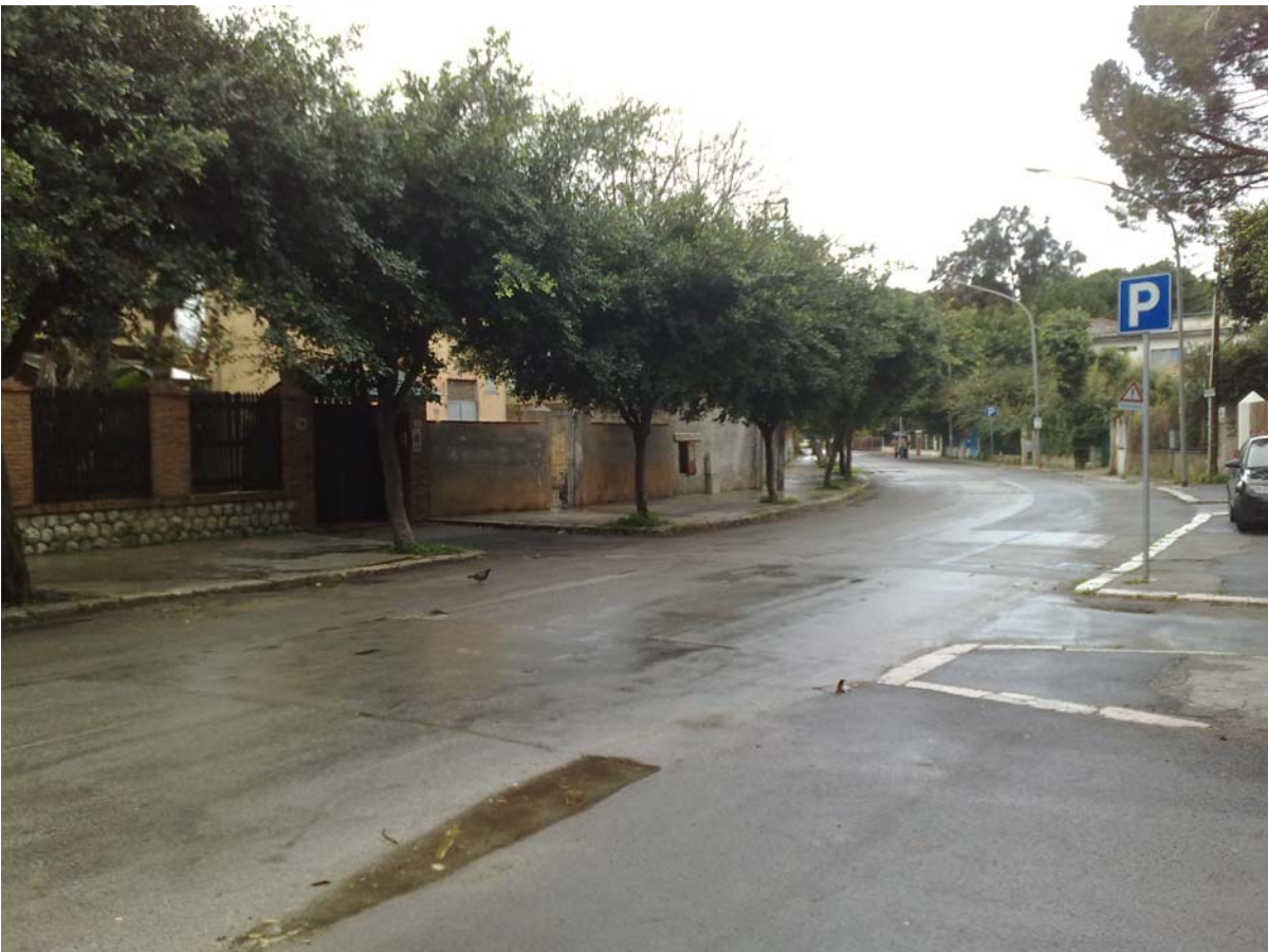
Foto16: Via Mondello