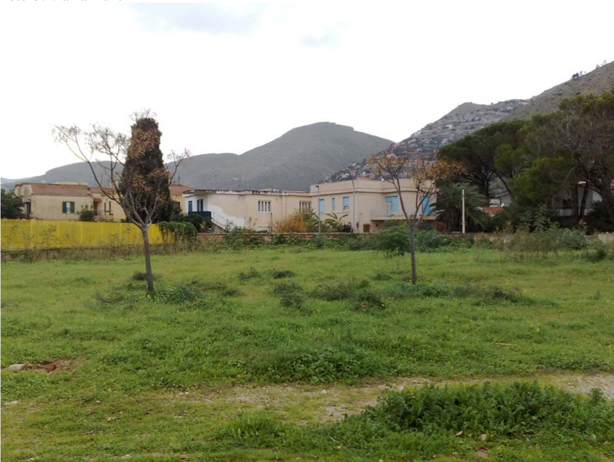
Foto14: Via Palinuro