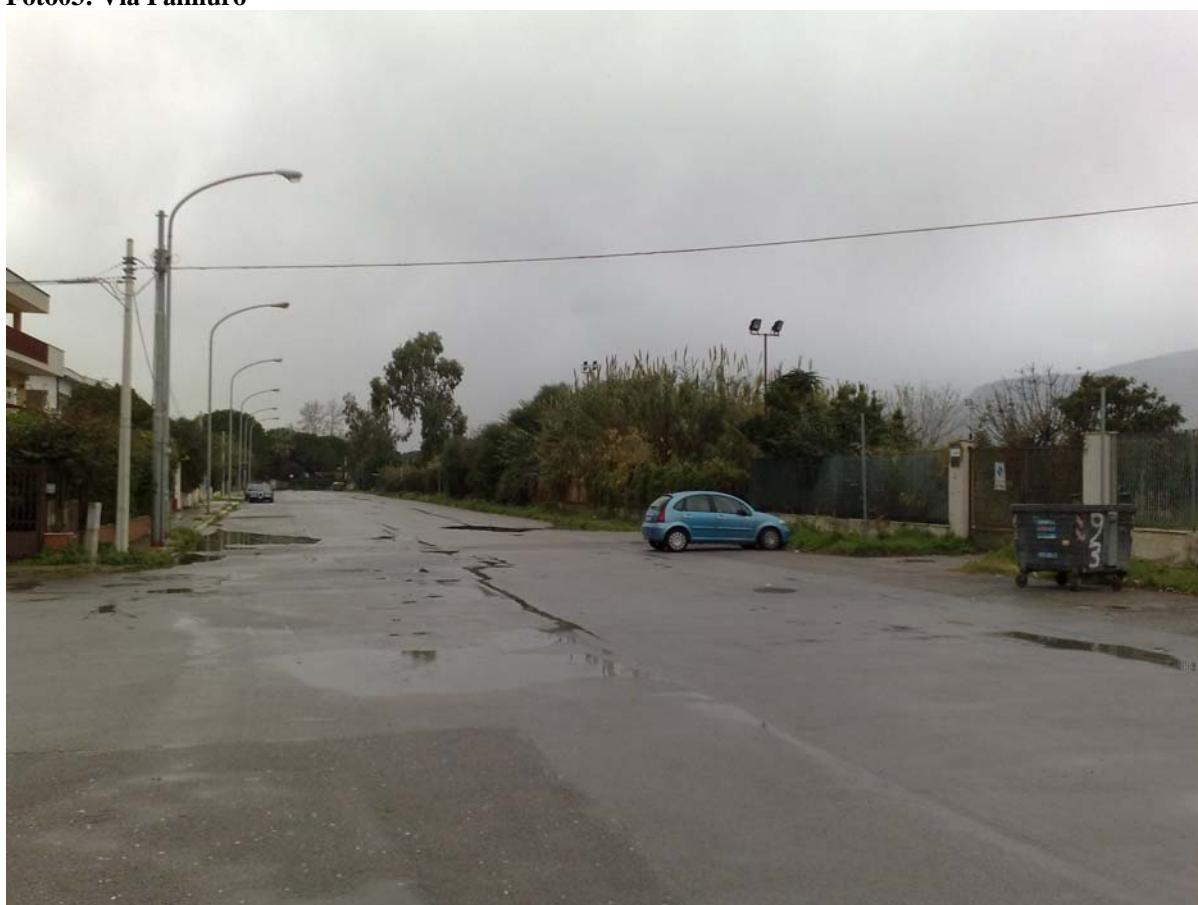
Foto04: Via Palinuro