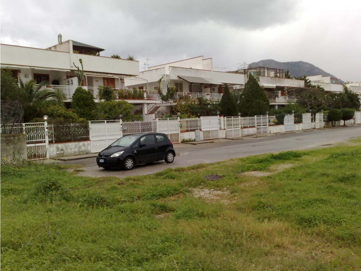
Foto11: Via Palinuro