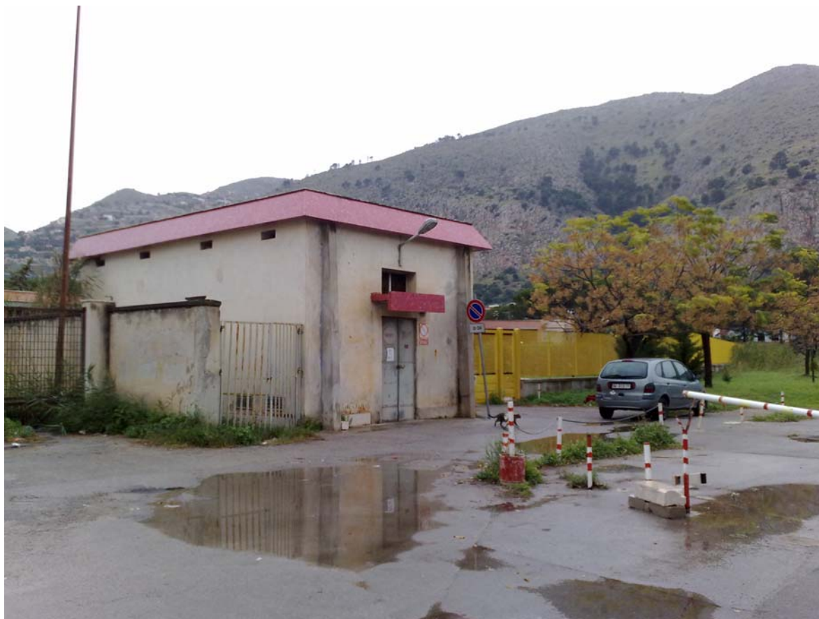
Foto01: Via Palinuro