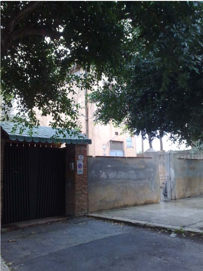
Foto18: Via Mondello