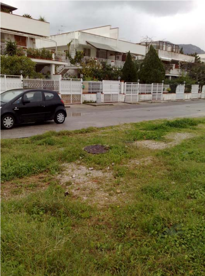
Foto12: Via Palinuro