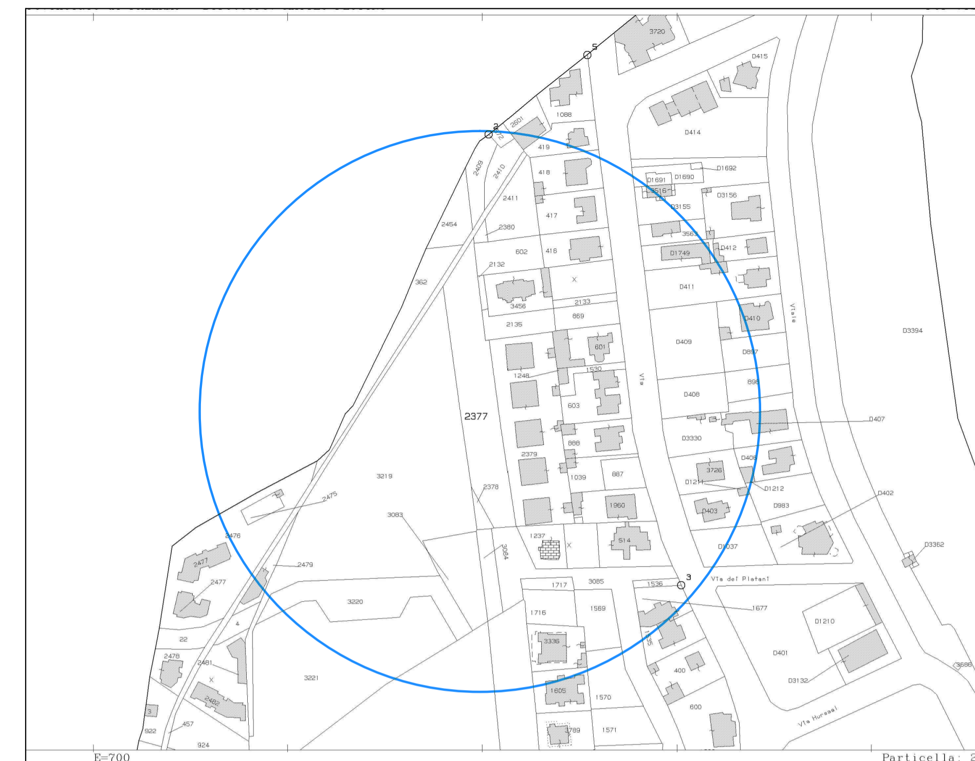
Stralcio Catastale Foglio n° 5 (Scala 1:2000)