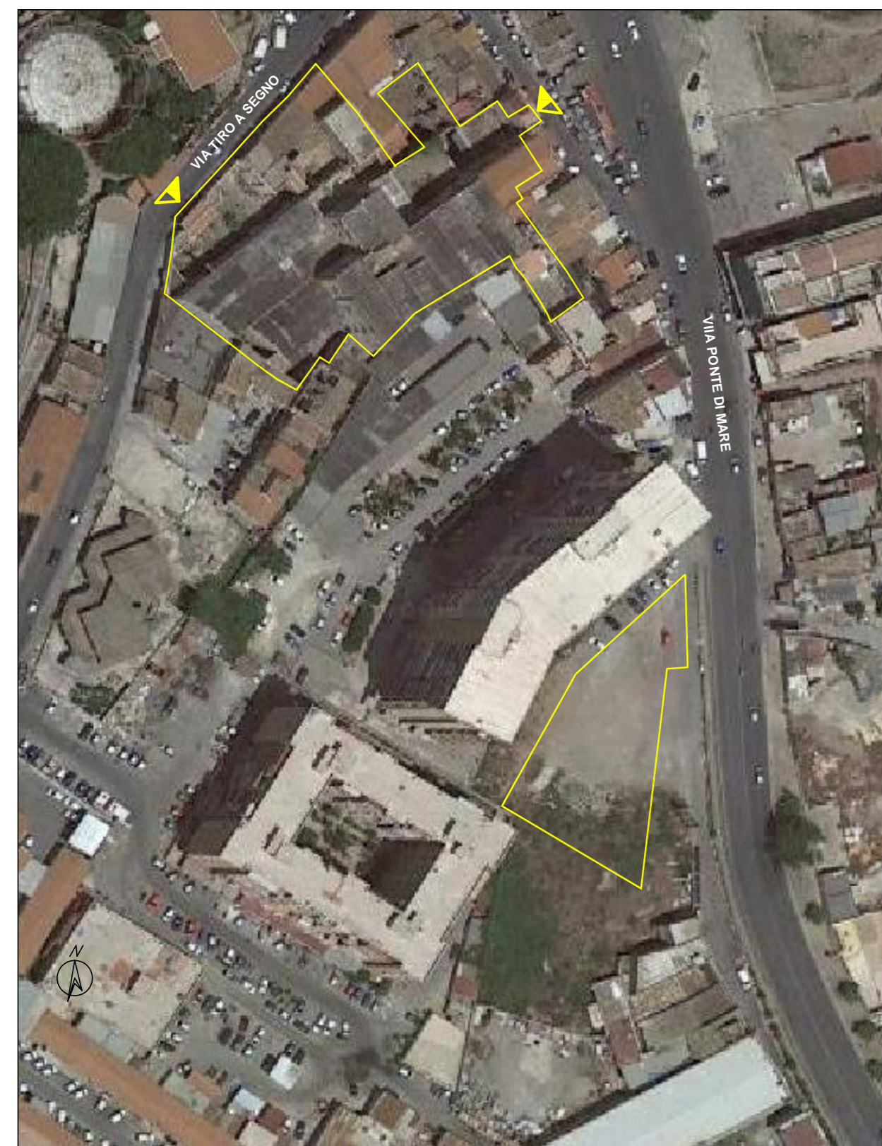
STRALCIO DI ORTOFOTO CON SOVRAPPOSIZIONE DELL'AREA DI INTERVENTO

— DELIMITAZIONE DELLE AREE SOTTOPOSTE A PIANIFICAZIONE