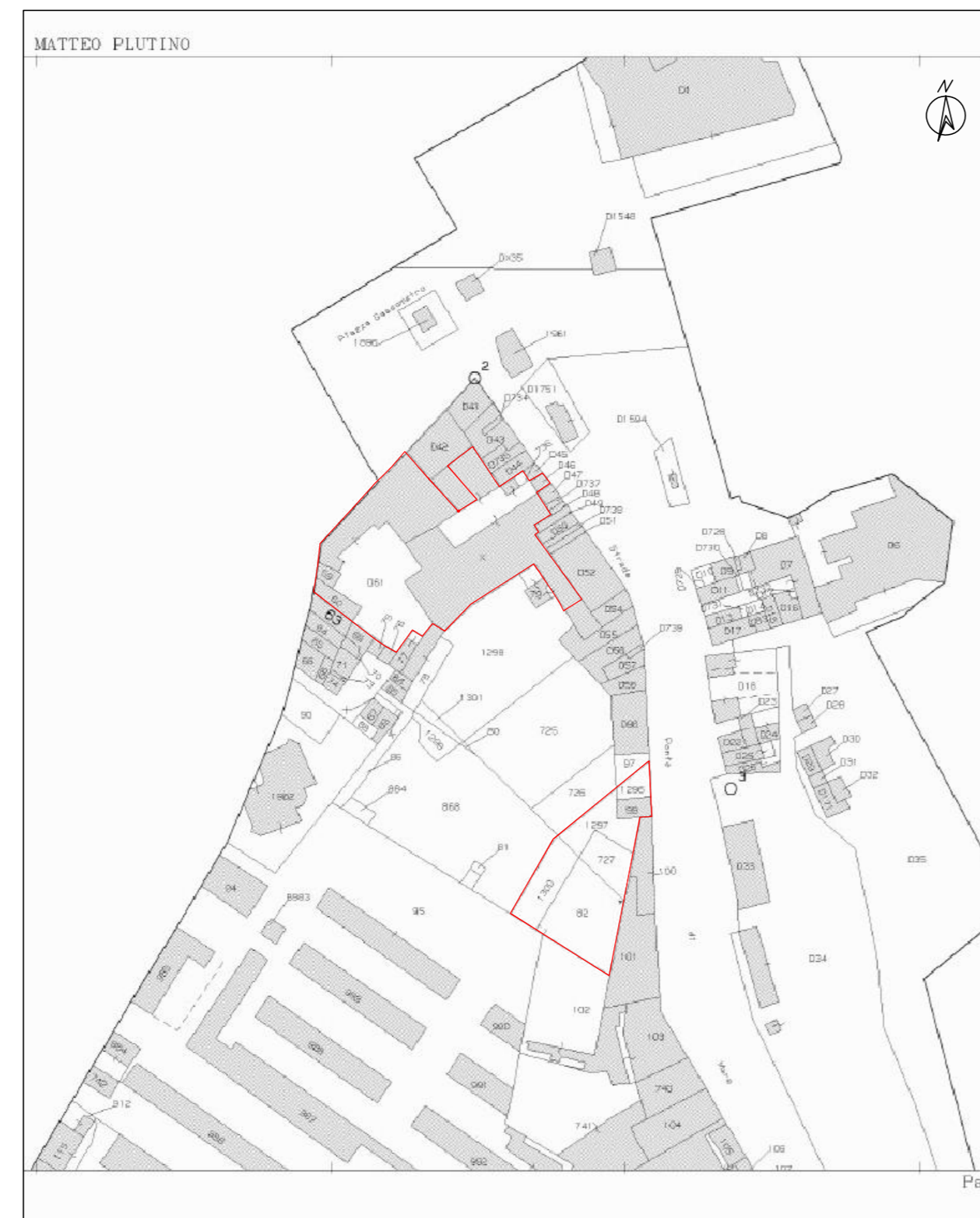
STRALCIO DI MAPPA CATASTALE – SCALA 1:2.000