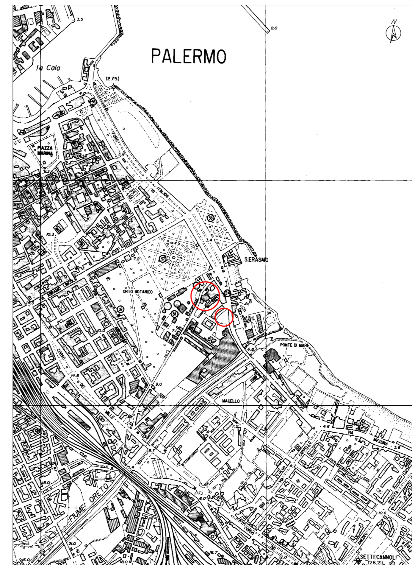
C.T.R. – SCALA 1:10.000