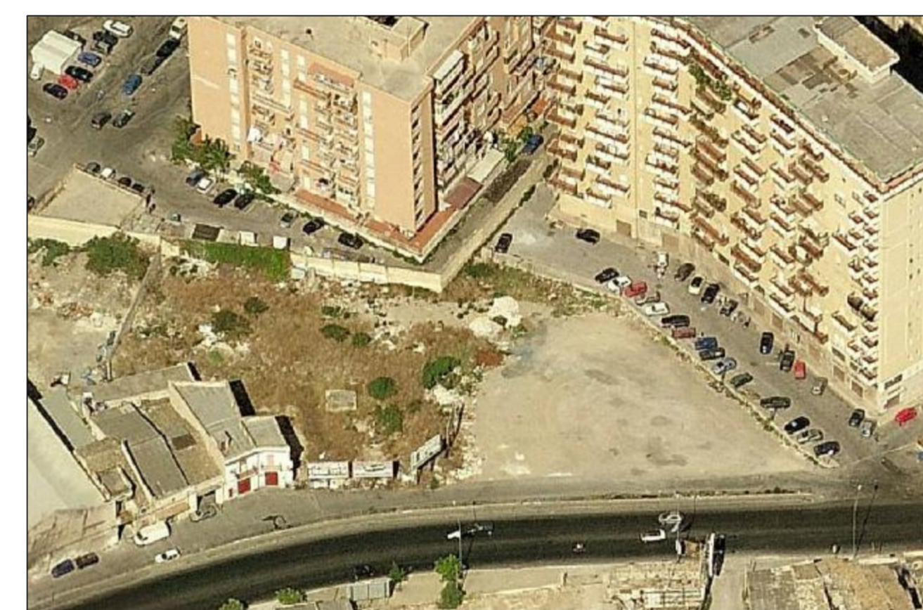
Vista da est